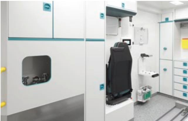
Der Innenausbau ist besonders strapazierfähig und wartungsarm.