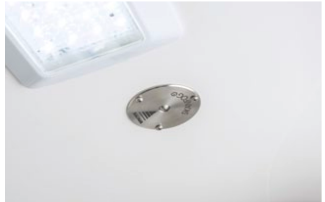
Das WAS SanSafe System beseitigt Krankheitserreger und Keime, selbst an schwer zugänglichen Stellen.