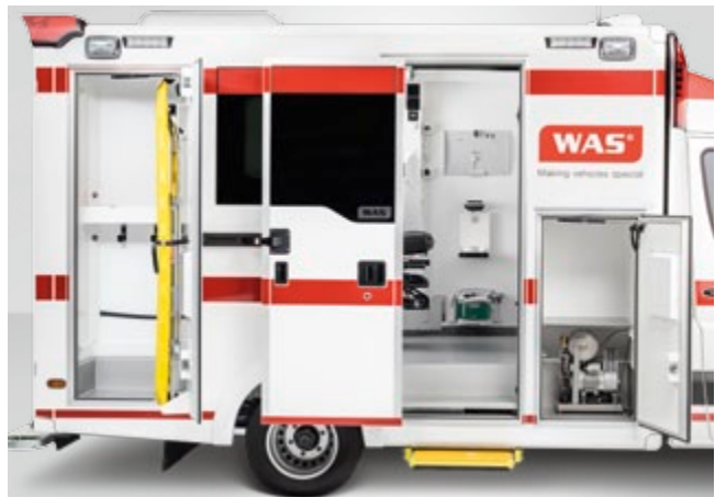
Funktionelle äußere Zugangsklappen sorgen für eine rasche Entnahme von Material und Ausrüstung.